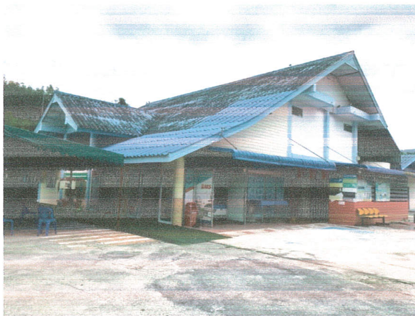
ภาพถ่ายจากด้านข้าง