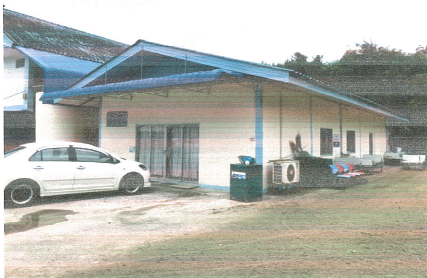
ภาพถ่ายจากด้านข้าง

๒. ห้องประชุม ค.ส.ล. ชั้นเดียว ชั้นทะเบียนหลังลำดับที่ รย.๒๑๒๑ ภาพถ่ายจากด้านหน้าและด้านข้าง