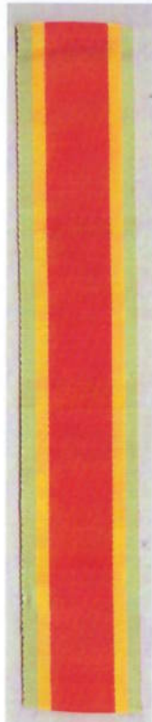
๒.จักรพรรดิมาลา