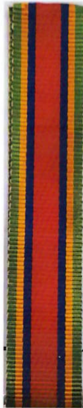
๓.จักรมาลา