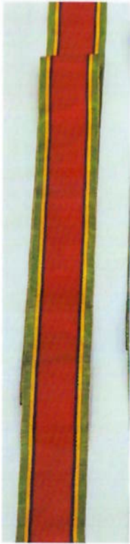
๑.ช้างเผือก