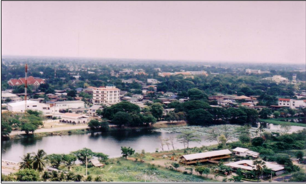
รูปคลองชะลมลูกที่ ๔ (ก่อนดำเนินการปรับปรุง)