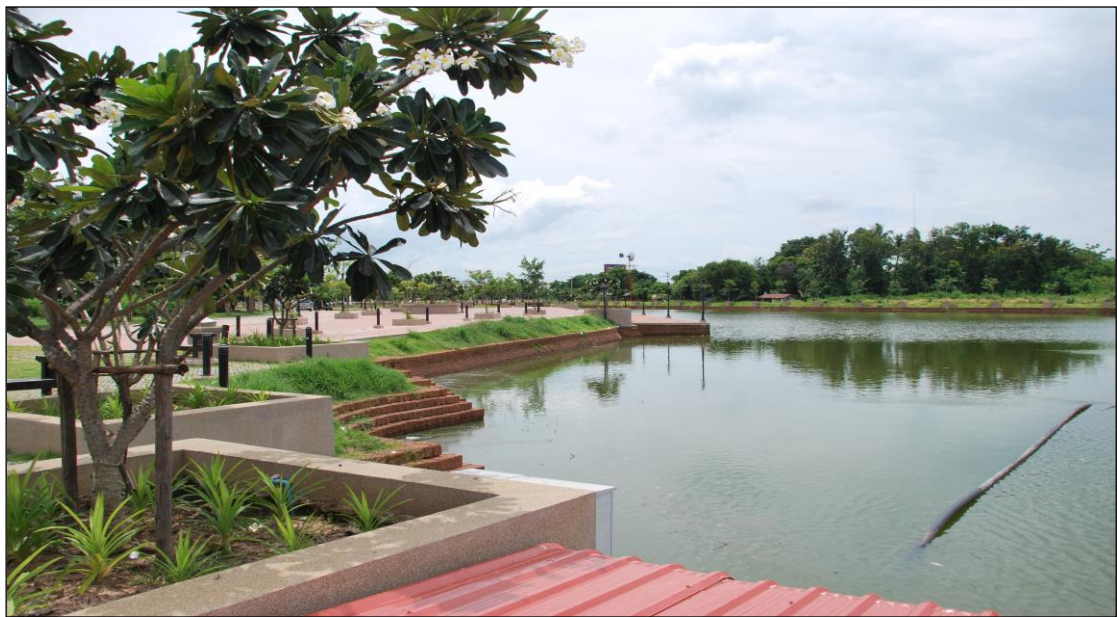
รูปคลองชะลมลูกที่ ๓ (ดำเนินการแล้วเสร็จ)