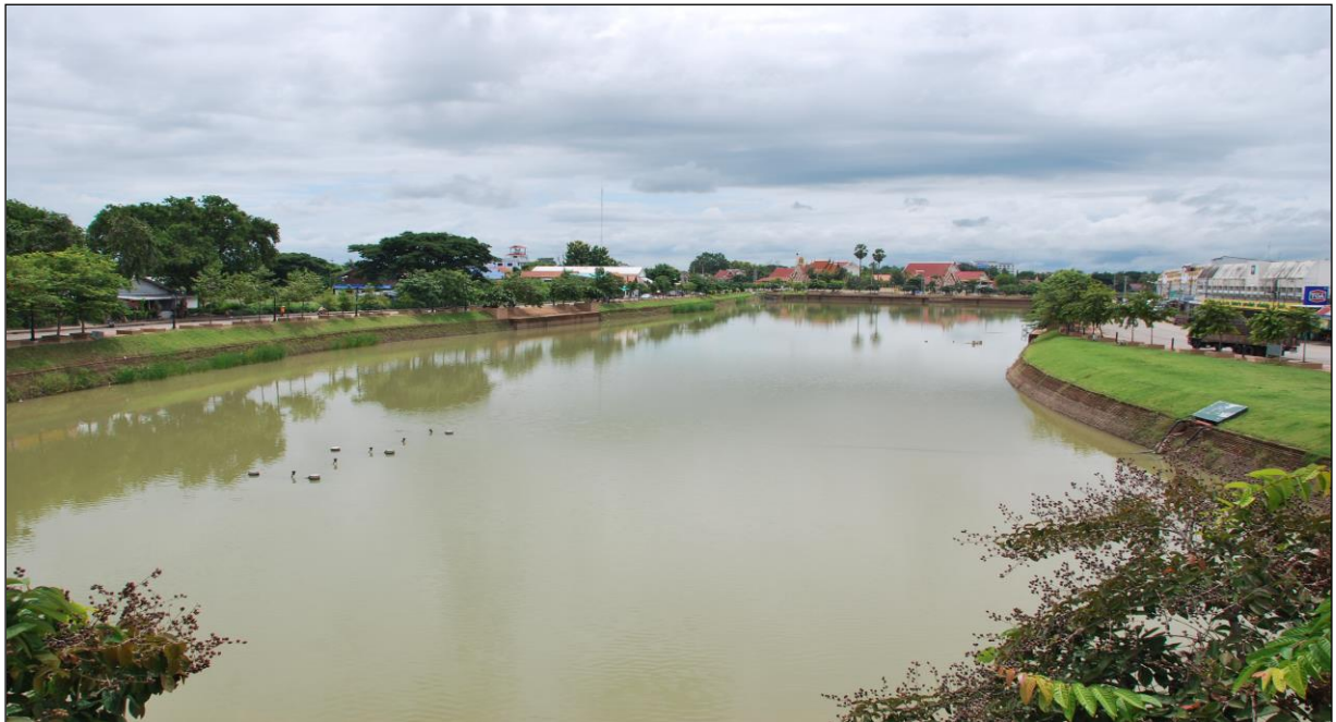
รูปคลองชะลมลูกที่ ๖ (ดำเนินการแล้วเสร็จ)