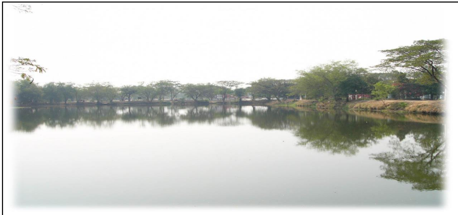
รูปคลองละมลูกที่ ๕ (ก่อนดำเนินการปรับปรุง)