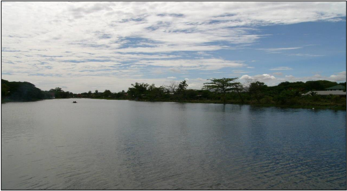
รูปคลองชะลมลูกที่ ๓ (ก่อนดำเนินการปรับปรุง)