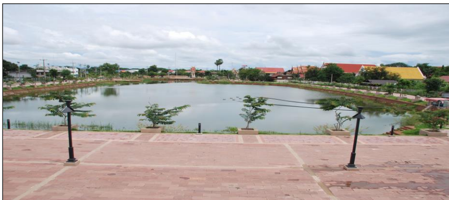
รูปคลองละมลูกที่ ๕ (ดำเนินการแล้วเสร็จ)