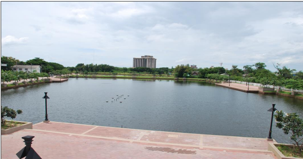
รูปคลองละมลูกที่ ๒ (ดำเนินการแล้วเสร็จ)