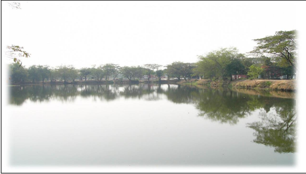
รูปคลองละมลูกที่ ๒ (ก่อนดำเนินการปรับปรุง)