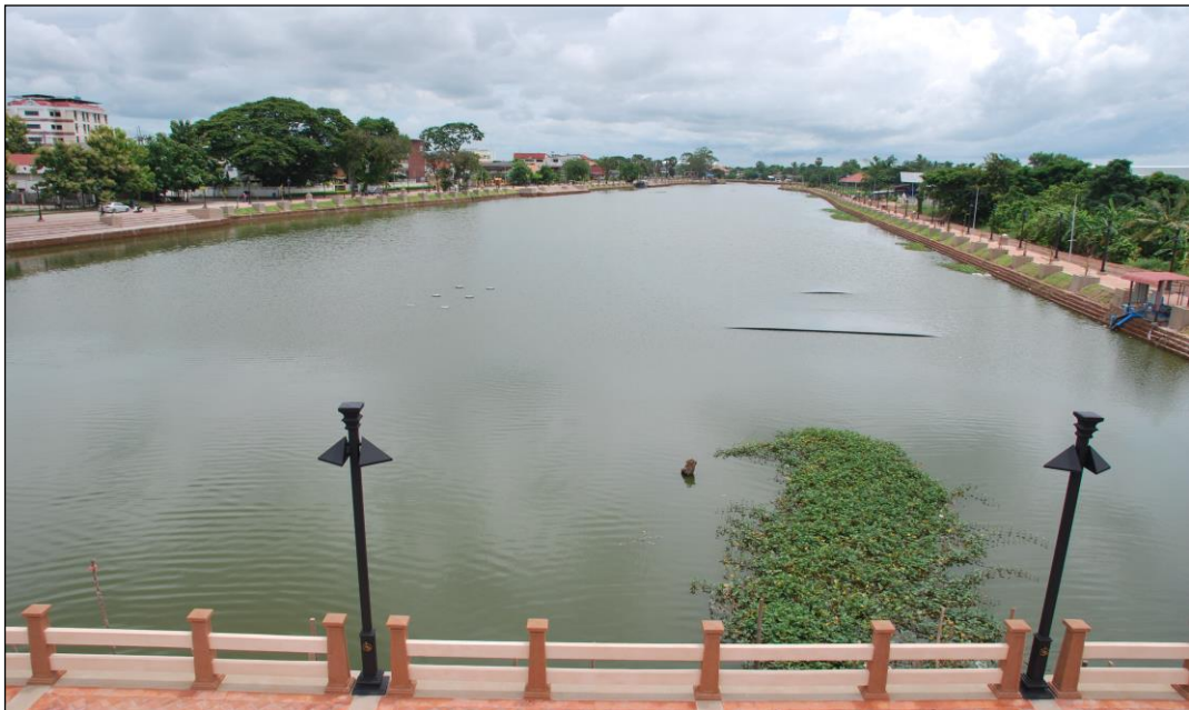
รูปคลองชะลมลูกที่ ๔ (ดำเนินการแล้วเสร็จ)