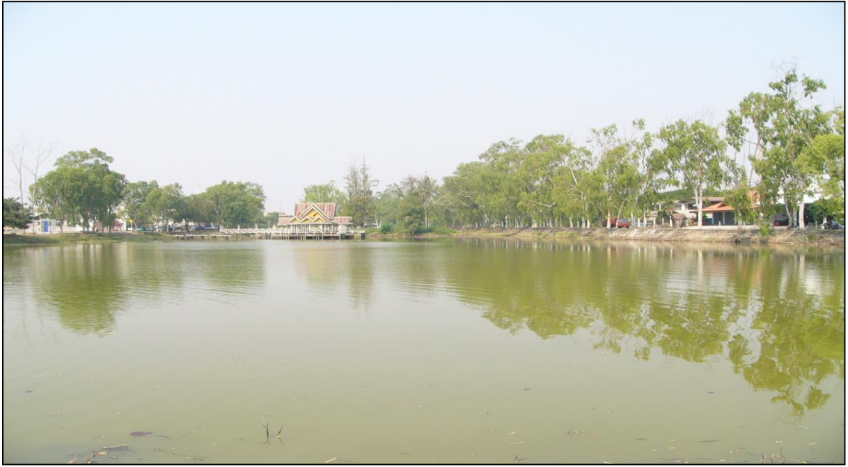
รูปคลองชะลมลูกที่ ๖ (ก่อนดำเนินการปรับปรุง)