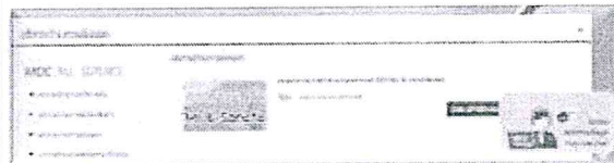
ภาพระบบ MOC e-Service